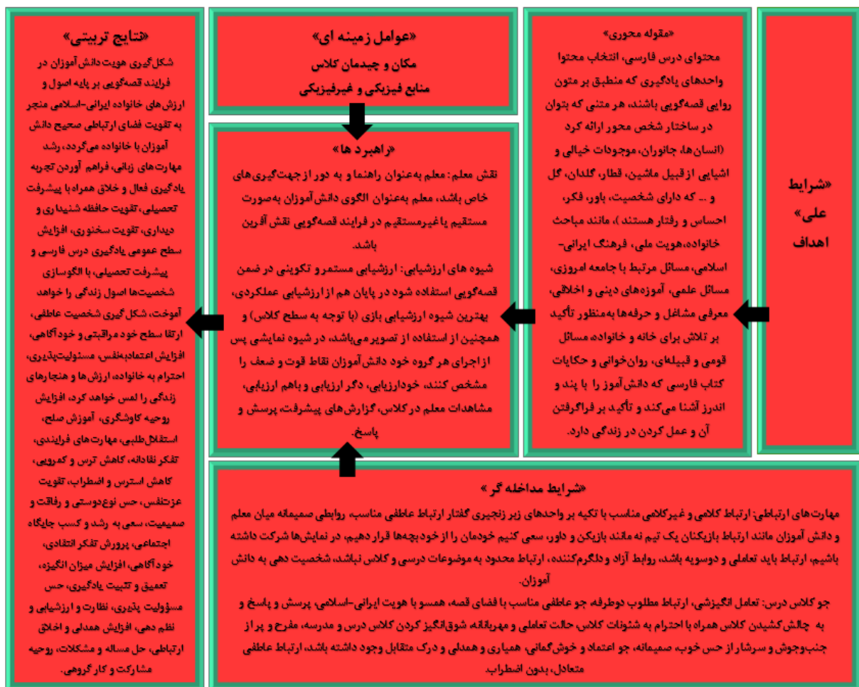
شکل ۱- مدل پارادایمی طراحی برنامه درسی آموزش فارسی با رویکرد قصه‌گویی در دوره ابتدایی: توسعه فرهنگ ایرانی-اسلامی در خانواده

در ادامه، با استفاده از فرایند کدگذاری انتخابی، الگوی مفهومی نهایی برنامه درسی مبتنی بر رویکرد قصه‌گویی در دوره ابتدایی نظام آموزشی ایران طراحی شد. در این مرحله، نظریه پرداز داده بنیاد برحسب فهم خود از متن پدیده مطالعه شده، در قالب پالایش مدل پارادایمی مرحله کدگذاری محوری و ارائه روابط مستتر در بین مقوله‌های موجود در مدل، نظریه خود را پیرامون پدیده محوری در قالب مجموعه‌ای از گزاره‌ها یا زیر گزاره‌ها ارائه داد. در این راستا پژوهش‌گر بر اساس تجارب و فهم خود از پدیده محوری مدل پارادایمی کدگذاری محوری یعنی (محتوا)، الهام از ادبیات نظری موجود و مصاحبه‌های مجدد با آزمودنی‌های پژوهش و دریافت نظرهای اصلاحی متخصصان امر و استادان دانشگاه، الگوی مفهومی نهایی را ترسیم کرد. پس از تهیه الگوی نهایی و در راستای اعتبارسنجی آن از متخصصین نیز استفاده شد، که الگوی مذکور مورد تأیید این افراد نیز قرار گرفت. شکل (۲) مدل مفهومی نهایی طراحی برنامه درسی آموزش فارسی مبتنی بر رویکرد قصه‌گویی در دوره ابتدایی: توسعه و ترویج فرهنگ ایرانی-اسلامی در خانواده بر اساس کدگذاری انتخابی را نشان می‌دهد.